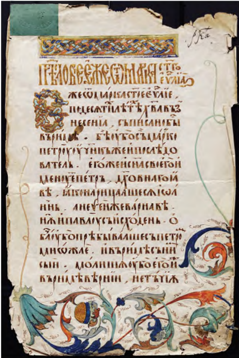
Рис. 1. Предисловие Феофилакта Болгарского к Евангелию от Марка. Евангелие тетр. Отрывок. Середина XVI в. Писец — Андрейчина. РГБ. Ф. 270.П. № 16/3