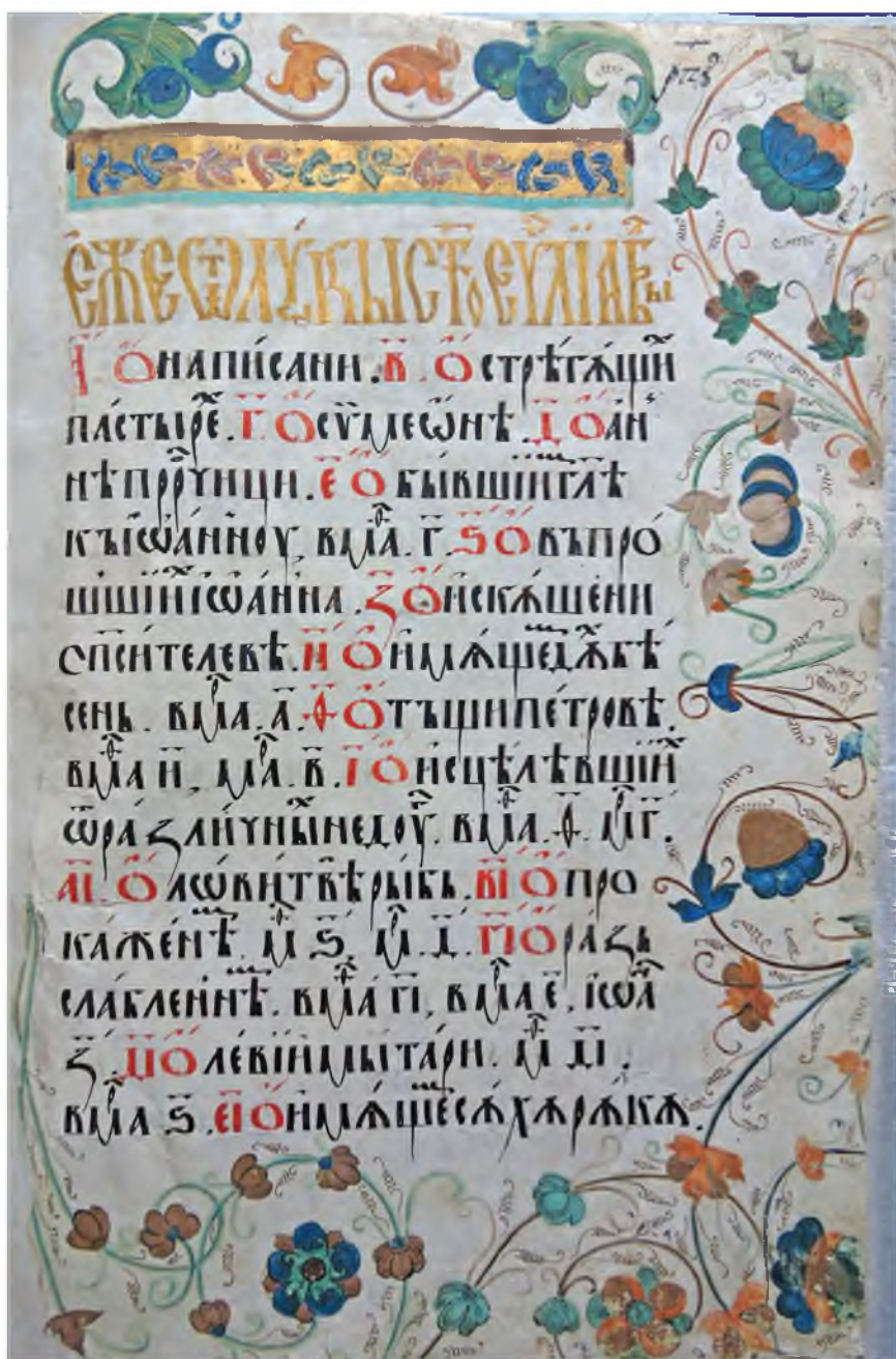
Рис. 3. Оглавление Евангелия от Луки. Евангелие тетр. Середина XVI в. Писец — Андрейчина. ИГИКМ 239. Л. 150